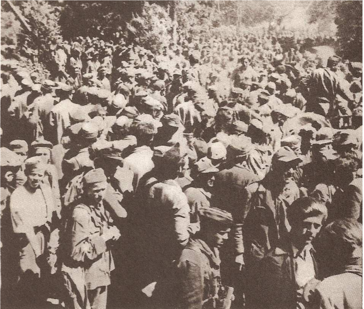
Zarobljeni hrvatski vojnici i civili prije križnog puta